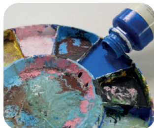
Farb- und Raumgestaltung