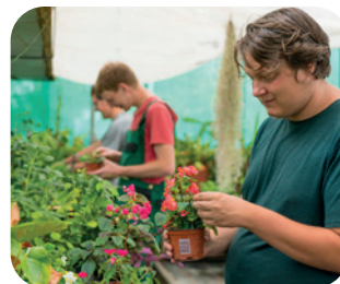
Garten- und Landschaftsbau